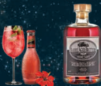
TONIC & HIBISCUS mixed with NEGRONI BY BARREL AGED BROTHERS