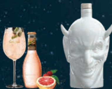
TONIC POMELO & NEPALESE BERRY mixed with FALLEN ANGEL BLOOD ORANGE GIN