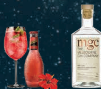
TONIC & HIBISCUS mixed with MGC THE MELBOURNE GIN COMPANY