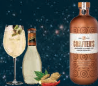
GINGER BEER & CHILI mixed with CRAFTER'S AROMATIC FLOWER GIN