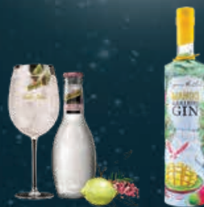
TONIC & PINK PEPPER mixed with COPPER IN THE CLOUDS MANGO & BLACK PEPPER GIN