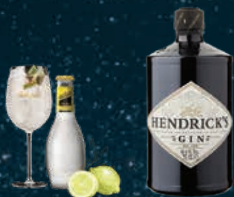
TONIC ORIGINAL & LIME mixed with HENDRICK'S GIN